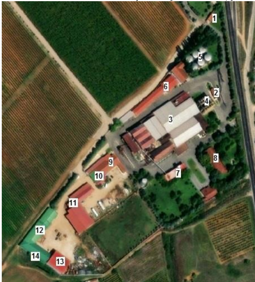
Слика: Распоред на објекти на локацијата